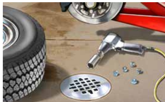
Sistema de drenaje de residuos sanitarios: un desagüe interno que desemboca en la planta de tratamiento de aguas residuales.