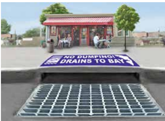
Cống Thoát Nước Mưa: Cống ngoài trời chảy trực tiếp vào các nhánh sông và Vịnh.

Nếu quý vị không biết chắc một cái cống nào đó dẫn đến cống thoát nước mưa hay cống nước thải sinh hoạt, hãy gọi cho cơ quan quản lý nguồn nước mưa địa phương để được hỗ trợ.