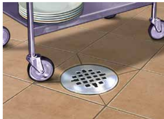
Cống Nước Thải Sinh Hoạt: Cống trong nhà chảy đến nhà máy xử lý chất thải.